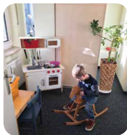
Im neu gestalteten Warteraum finden Kinder Beschäftigungsmöglichkeiten.

Zur Schwangerschaftskonfliktberatung von donum vitae kommen Frauen, die einen Schwangerschaftsabbruch in Erwägung ziehen. Als Grund nennen die Betroffenen häufig die Tatsache, dass der Kindesvater nicht zur Schwangerschaft stehe, die berufliche oder auch finanzielle Situation, die körperliche und psychische Verfassung, eine bereits abgeschlossene Familienplanung oder das eigene Alter.