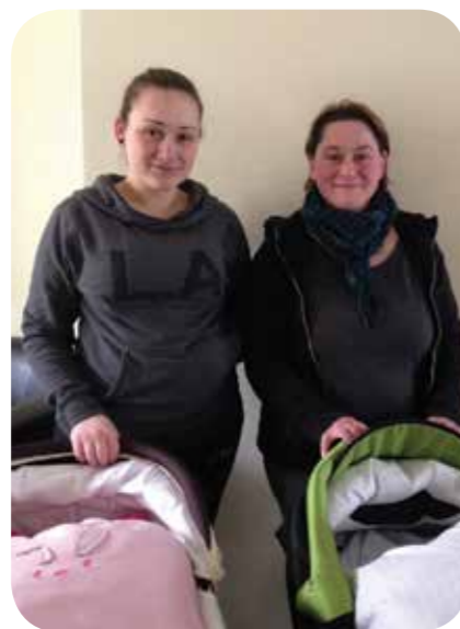
Mutter und Tochter mit ihren Babys bei donum vitae.

Immer häufiger kommen Frauen und Paare auch zur Kinderwunschberatung. 91 Familien wünschten sich Beratung und Begleitung auch nach der Geburt.